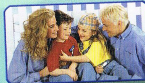
Die ganze Familie in guten Händen